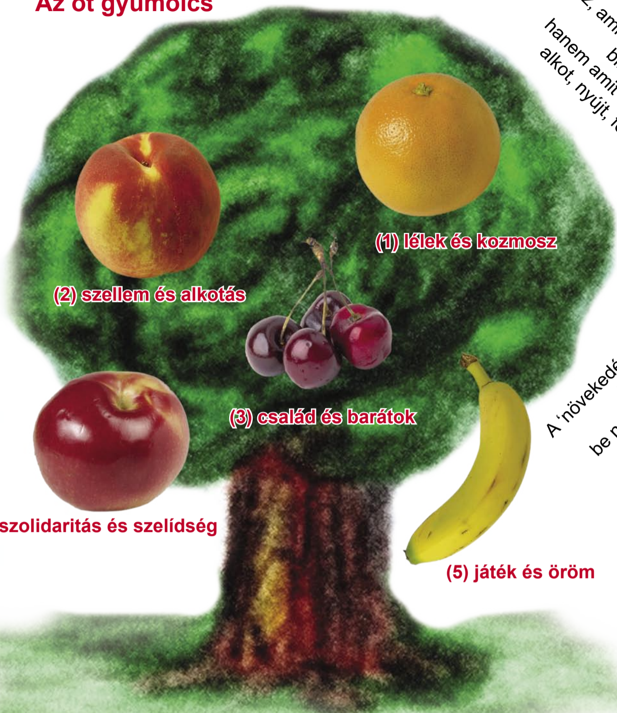
(1) lélek és kozmosz