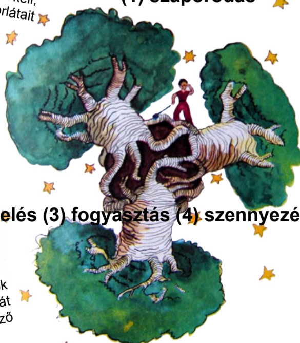
(2) termelés (3) fogyasztás (4) szennyezés